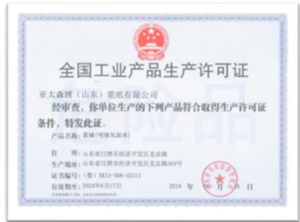
氯碱产品生产许可证