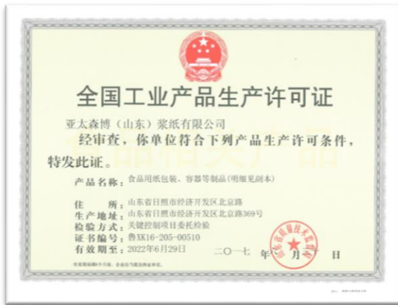
食品包装纸板生产许可证