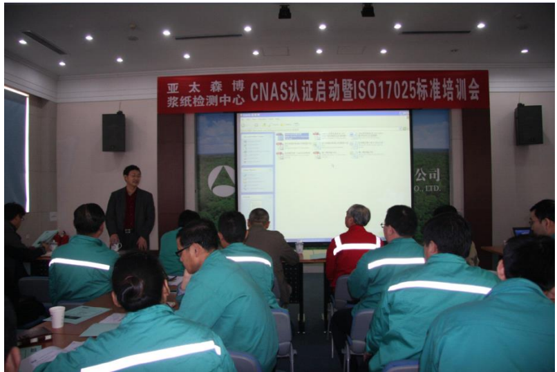
亚太森博CNAS实验室认可/ISO17025标准培训