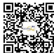
公司产品品牌博旺微信公众号